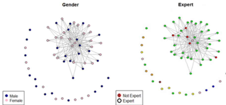
شکل ۳: همگرایی اعضای شبکه همکاری علمی مشاهده شده بر حسب جنسیت و تخصص