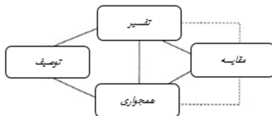
شکل ۱: بازنمایی روش تحقیق پژوهش

این مطالعه از نوع کیفی بوده و با رویکرد مطالعه‌ی تطبیقی انجام شده است. تطبیق و مقایسه به عملی اطلاق می‌شود که در آن دو یا چند پدیده را در کنار هم قرار داده، به منظور یافتن وجوه اختلاف و تشابه آن‌ها را مورد تجزیه و تحلیل قرار دهیم. از این رو، در رویکردهای جدید عمدتاً به روش تطبیقی به مثابه یک لنز نگریسته می‌شود که می‌توان با آن محیط دور و نزدیک را همزمان مشاهده کرد و مستمراً موقعیت خود را نسبت به دیگران سنجید (ذاکر صالحی، ۱۳۹۶: ۸۳). این مطالعه تطبیقی با بهره‌گیری از الگوی جورج بردی (۱۹۶۹) انجام شده است.