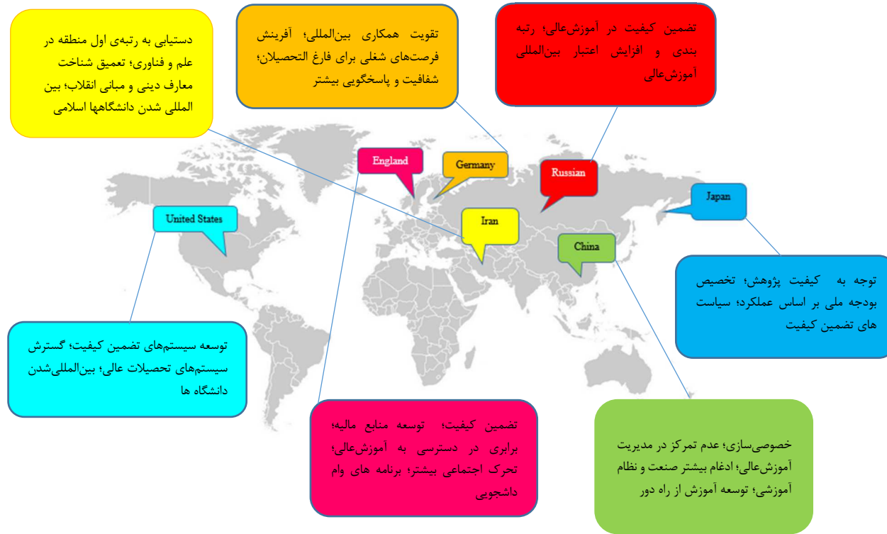
شکل ۳: اهم سیاست‌های آموزش عالی کشورهای مورد مطالعه

در ادامه در شکل (۳) اهم سیاست‌های آموزش عالی کشورهای مورد مطالعه به صورت نقشه‌نگاری به تصویر کشیده می‌شود.